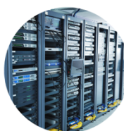
サーバーールーム

『温湿度監視システム』は、それらの場所で、休日夜間も含め 24 時間 365 日、温湿度を自動監視してあらかじめ設定した範囲外になると通知します。