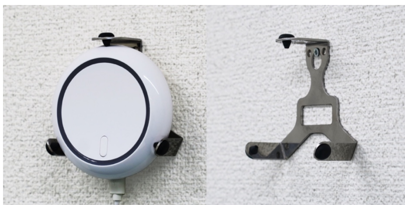
(例) オプション：LTE-BLE ルーター壁面取付金具